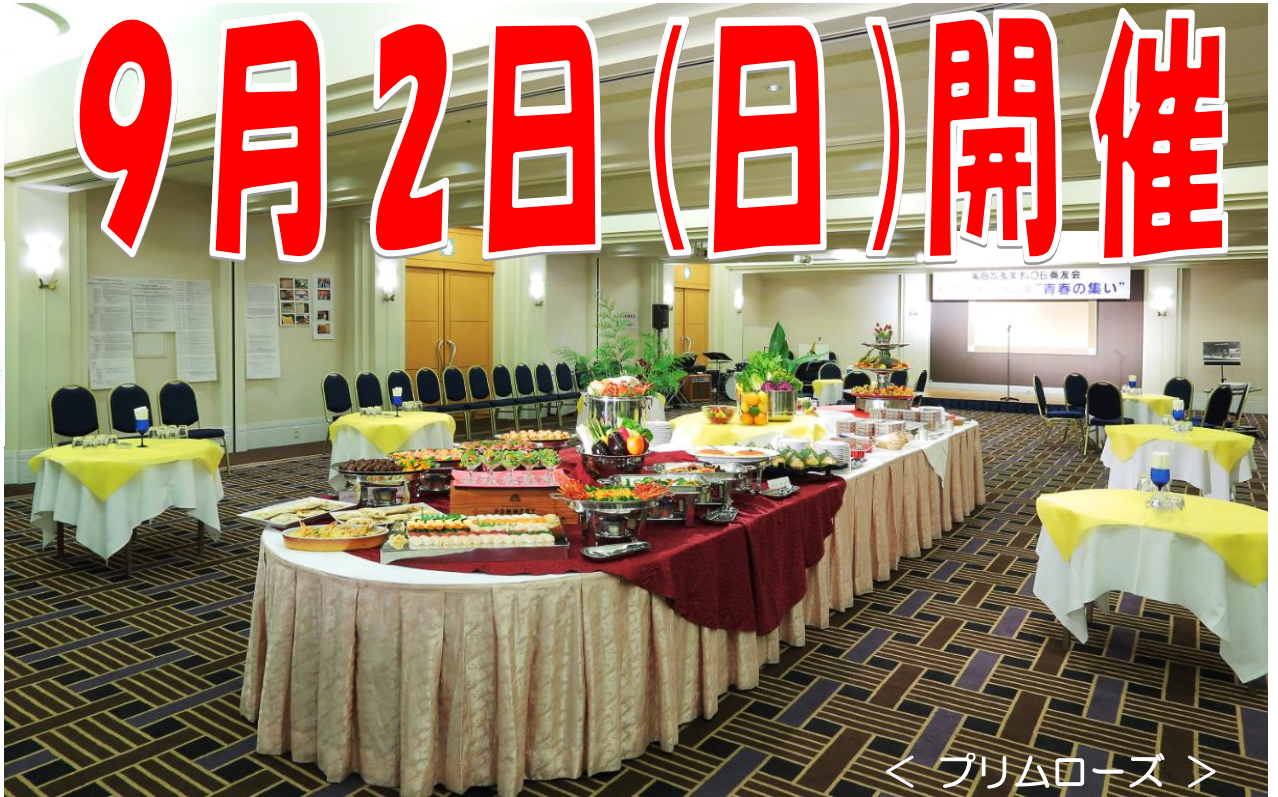
< プリムローズ >

日時 平成30年9月2日(日) 午後1時00分～午後4時00分 (受付開始: 午後12時30分から)